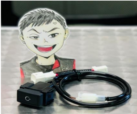
・K13改用日産Aタイプスイッチ